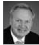
Wolfgang Gerstner Oberbürgermeister der Stadt Baden-Baden