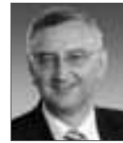
Peter Schneider MdL Präsident des Sparkassenverbands Baden-Württemberg