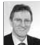
Roland Bernhard Landrat Landkreis Böblingen