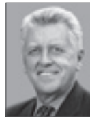
Ernst Pfister MdL Wirtschaftsminister des Landes Baden-Württemberg